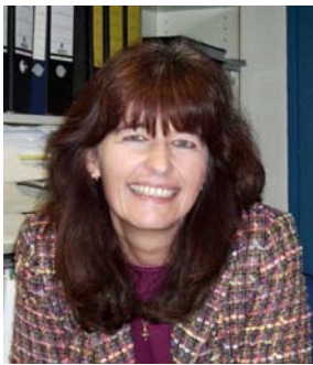
Marion Straub Charterberatung Extratour Seychellen, Tahiti, Kuba Flugbuchungen